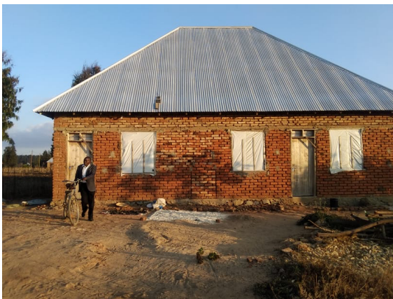
Aktueller Baufortschritt im Juli 2022

In der Nähe des Krankenhauses baut die Gemeinde auf eigenem Grund ein Gästehaus. Von der Vermietung der Räumlichkeiten erhofft sie sich laufende Einnahmen.